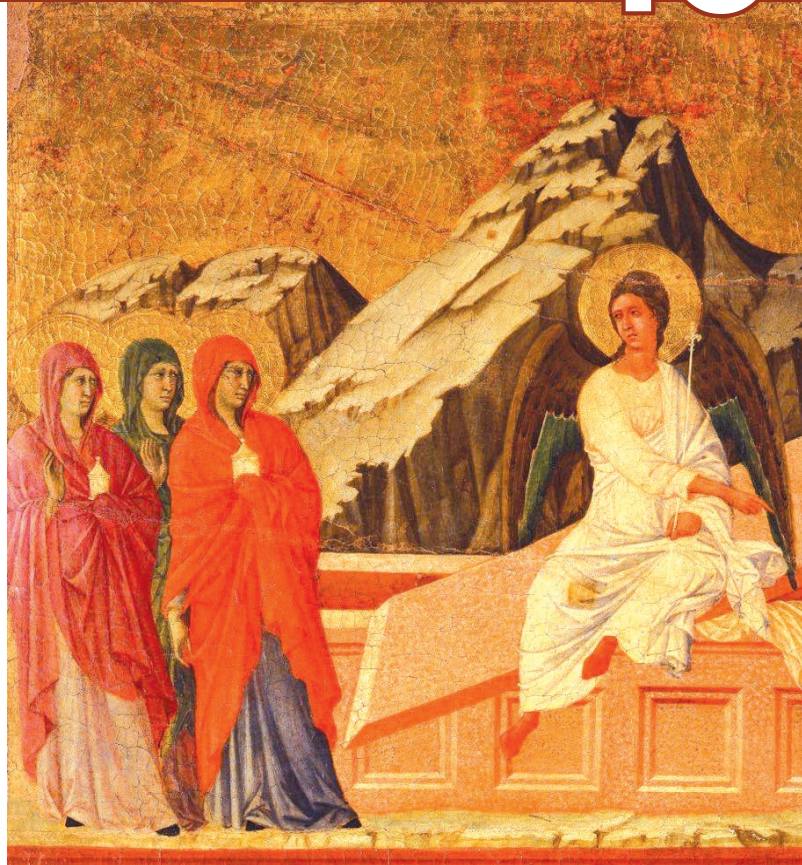
Duccio di Buoninsegna, Siena, Museo dell'Opera del Duomo

Fiduciosi che i vaccini producano a breve benefici effetti, abbiamo programmato da giugno a dicembre 2021 alcune iniziative, con il proposito di offrire alla popolazione imolese momenti di sana convivialità e cultura: vorremmo proporre "Il volo", una libera interpretazione della fiaba "la gabbianella e il gatto che le insegnò a volare" di Luis Sepulveda. La programmazione proseguirà con la nostra annuale Assemblea Soci, lo spettacolo "La sagra